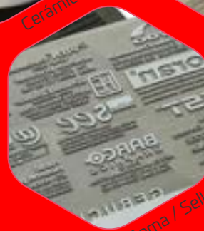
Carta / Sellos